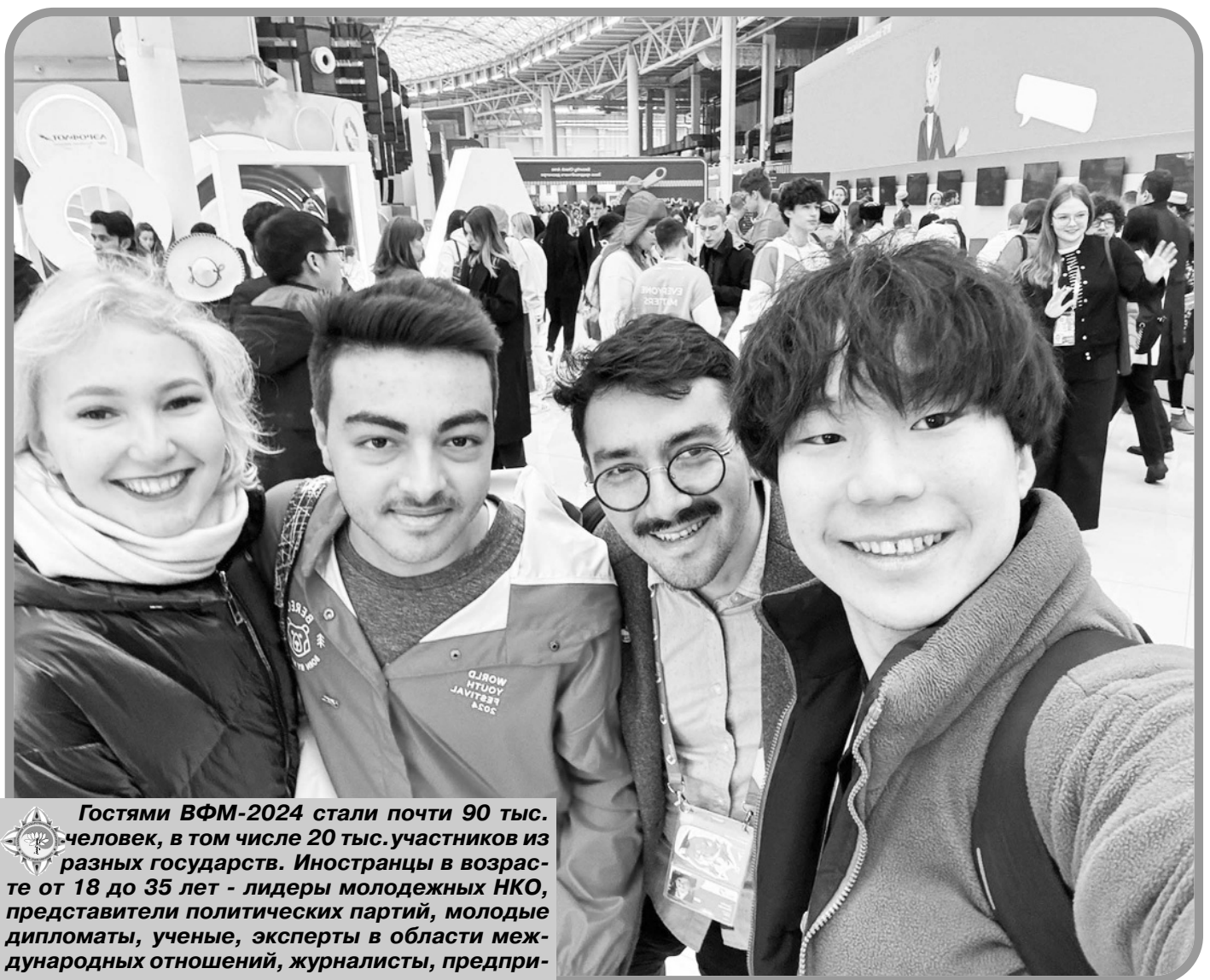
Гостями ВФМ-2024 стали почти 90 тыс. человек, в том числе 20 тыс. участников из разных государств. Иностранцы в возрасте от 18 до 35 лет - лидеры молодежных НКО, представители политических партий, молодые дипломаты, ученые, эксперты в области международных отношений, журналисты, предприниматели, деятели культуры и студенты - приехали из 188 стран.

На фестивале достигнуты договоренности по продвижению русского языка за рубежом с замруководителя Россотруд-